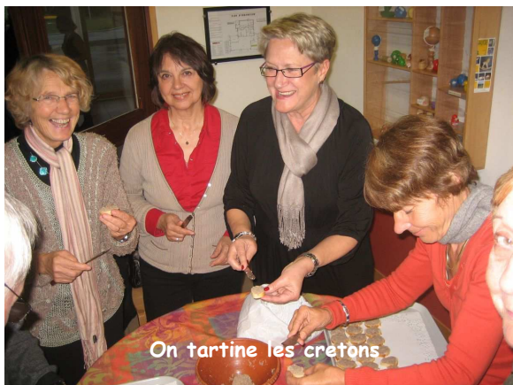
On tartine les crêtons

A l'entracte, nous avons proposé au public une