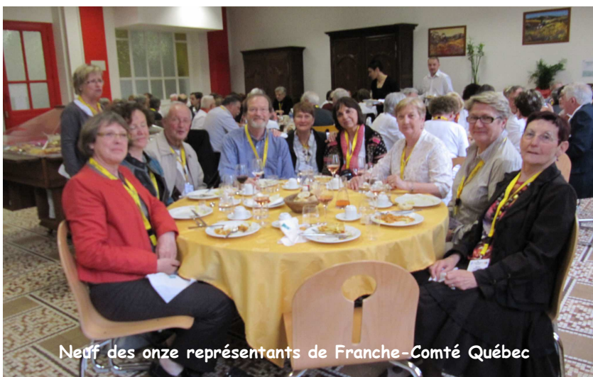
Neuf des onze représentants de Franche-Comté Québec